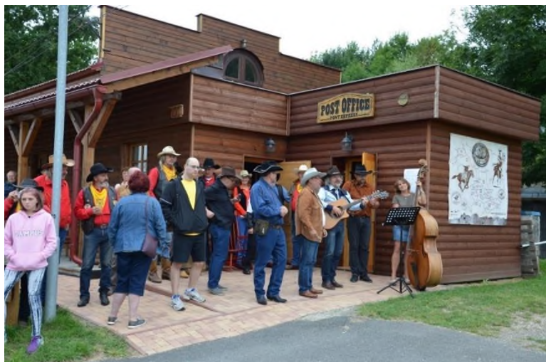
Čekání na příjezd jezdců s koňskou poštou Pony Expressu

„Pro Suchdol nad Odrou a všechny ‚westernáky‘ z okolí to bude velký svátek,“ „Bude to zase jako každý rok nádherná romantika,“ těšíme se.