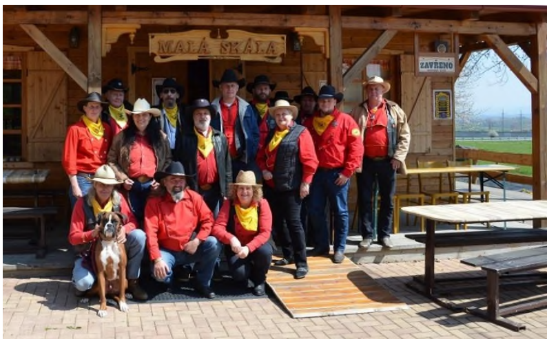
Členové RADY Pony Expressu

Zaoceánská jezdecká pošta si zakládala na tom, že zásilku doručí adresátovi dříve než ta dostavníková. V Suchdole nad Odrou se můžete přesvědčit, zda tenhle husarský kousek svede i současný Pony Express v konkurenci s moderní poštou!