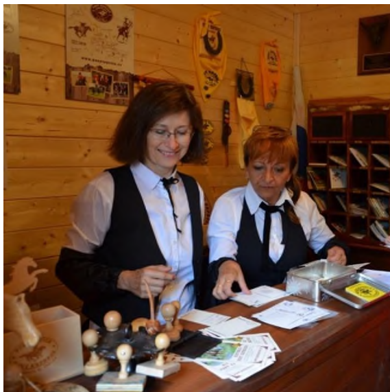
Poštovní úřad - Post Office č. 21 Suchdol nad Odrou - Kletné