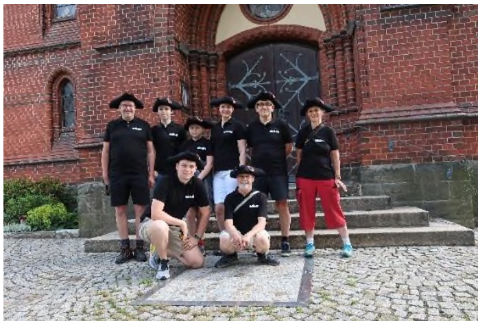
Naše putující část výpravy