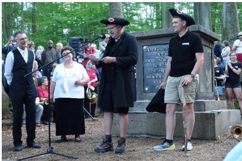
Pozdravná řeč u památníku, kde byl skácen první strom