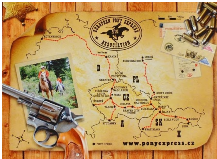
Pohlednice s mapou tras Evropského Pony Expressu

Suchdol nad Odrou je místem zaslíbeným koním a westernu. V roce 1985 tady končila první jízda Československého Pony Expressu , jež začínala ve 400 kilometrů vzdálené Stříbrné Lhotě u Mníšku pod Brdy. U zrodu štafetové jízdy stál suchdolský usedlík a nestor westernového ježdění Bohumil Kašpárek zvaný Hospodář.